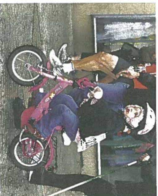
Jede Runde zählt. Auch wenn nicht alle Stadtläufer zu Fuß unterwegs sind, sondern auch auf dem Rad.

Organisiert wurde der Stadtlauf erneut vom Caritasverband für den Schwarzwald-Baar-Kreis und der Volksbank eG Villingen. Die spendete für jede vollendete Runde jedes einzelnen Läufers einen Euro zu Gunsten des Caritasverbandes. Für jeweils vier Runden, eine so genannte „badische Meile“ legte die Volksbank einen weiteren Euro drauf. Mit dem erlaufenen Erlös wird in diesem Jahr der Föhrenhof unterstützt.